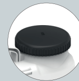
Amplia boca de llenado con filtro