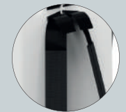
Correas acolchadas y regulables