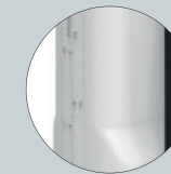
Depósito translúcido con indicador de nivel