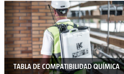
TABLA DE COMPATIBILIDAD QUÍMICA