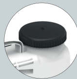
Tapa depósito con válvula antigoteo