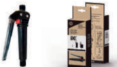
MANETA IK (INOX) cod. 8.26.71.872

Manguera de diámetro 12mm. Aporta facilidad de movimiento y resistencia química.