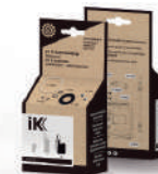
JUEGO DE BOQUILLAS PARA PULVERIZADORIK MULTI 6-9-12, 12BS / PRO 9-12 cod. 8.26.71.871