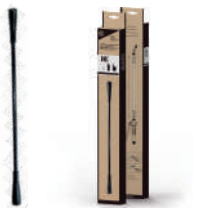
TUBO DE FIBRA DE VIDRIO CON TUERCAS DE 47 CM cod. 8.26.71.873

Maneta versátil y adaptable a cada aplicación.